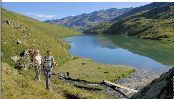
Randonnée dans les Alpes (les Ménuires)