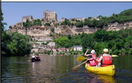
Canoë sur la Dordogne